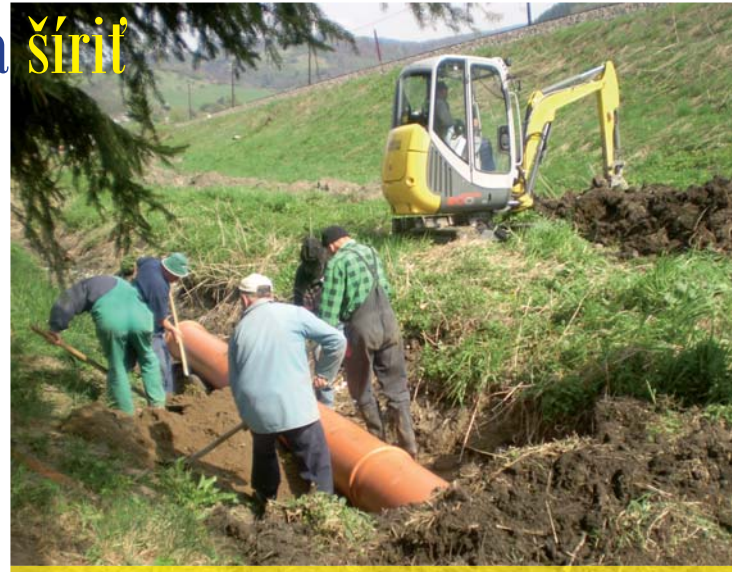
Postup prác pri kladení odtokového potrubia

nicky zúčastnili 2 občania plus 3 aktivační pracovníci obce. Vypomáhal aj obecný traktor s radlicou a vlečkou.