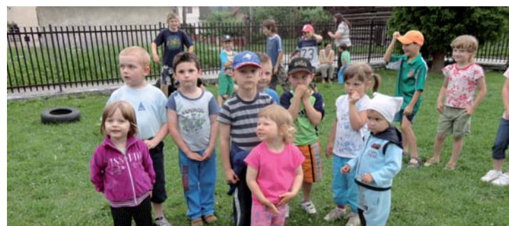
Ratolesti pózujú pred objektívom.