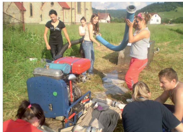
Predpríprava žien na okresnú súťaž

Táto námaha nevyšla nazmar a v deň okresnej súťaže v Párnici družstvo žien zabodovalo a obsadilo 2. miesto. Družstvo mužov dosiahlo 11. miesto. Dúfame, že na budúce sa mládenci pousilujú a vychytia lepšie umiestnenie. Nič iné nezostáva, len posnažiť sa!