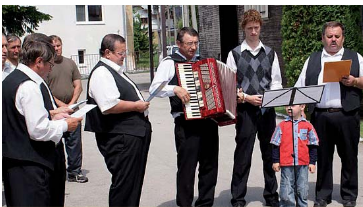
Mužský zbor obce Sediacka Dubová