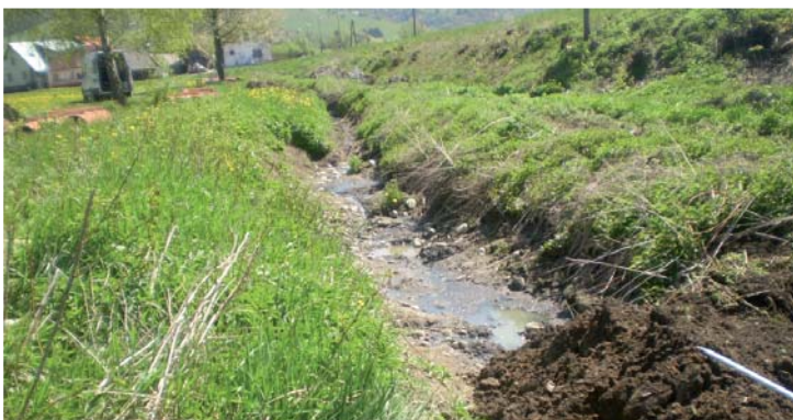
Takto vyzerala Jama pred úpravou