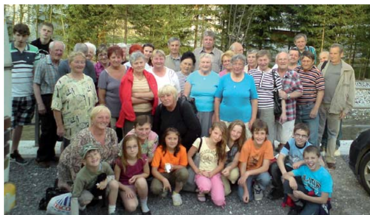
Spoločné foto účastníkov kúpania.

Pobytu na kúpalisku sa zúčastnilo 34 dospelých osôb, 10 žiakov ZŠ a dve deti, spolu 46 osôb. Niektorí sa vyjadrili, žeby sa kúpanie mohlo aj častejšie opakovať. Všetko závisí od financií, no napriek tomu kúpalisko v tomto roku navštívia naši dôchodcovia ešte dvakrát. Takže už teraz sa tešia dôchodcovia na ďalšie akcie. ■ ph