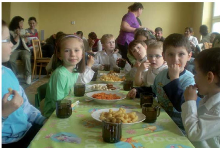
Mamičky a ich ratolesti pri sladkostiach.