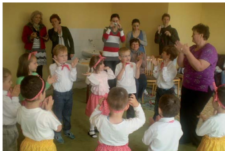
Škôlkari predvádzajú program.