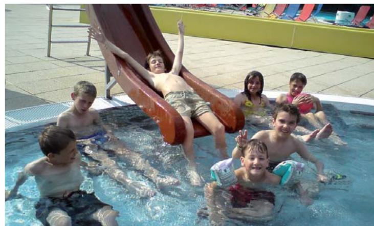
Takto si to predstavovali: tobogán.