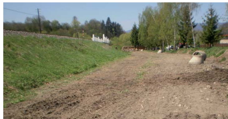
Jama po úprave