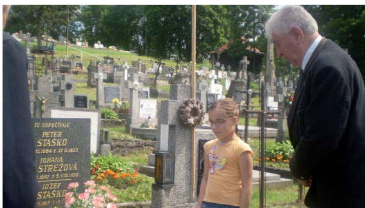
Kladenie kytice na hrob.