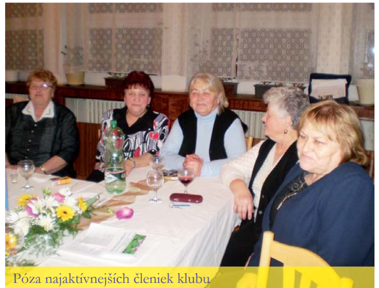
Póza najaktívnejších členiek klubu

sených členov sa neuskutočnila spoločná návšteva Zakopaného a Wadovic v Poľskej republike. Popri hodnotiacej správe dôchodcovia odsúhlasili akcie pre rok 2013. Stotožnili sa s tým, aby sa zachovali tie akcie, ktoré doteraz sa uskutočňovali. Jedine padol návrh, aby sa zorganizoval dôchodcovský ples v zimnom období na začiatku 2014 roku. Všetci s týmto návrhom súhlasili. Do organizovania plesu by sa zapojili všetky organizácie JDS v okrese, t.j. od Kraľovian, Zázrivej, Dolného Kubína až po Krivú a mal by byť reprezentácnou akciou pre okres. Výbor organizácie JDS prisľúbil, že sa pokúsi urobiť všetko, aby sa ples uskutočnil a to predovšetkým v spolupráci s miestnym obecným úradom.