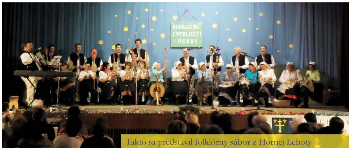
Takto sa predstavil folklórny súbor z Hornej Lehoty