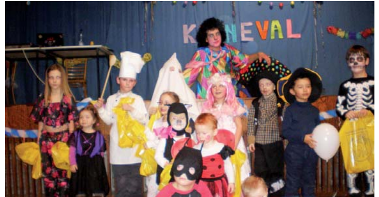
Takto pózovali masky pred objektívom

Program karnevalu sa postupne gradoval. Po predstavení masiek, po tanci, súťažiaci