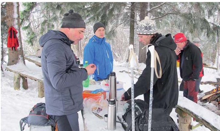
Občerstvenie pri Troch sosnách

Je pekné, keď sa takéto tradície v našej obci udržiavajú, iste to prispieva k propagácii celého oravského regiónu a potom sa nečudujme, že naša obec už po tretí raz sa stala najkrajšou obcou Slovenska na portáli SLOVAKREGION. ■ ph