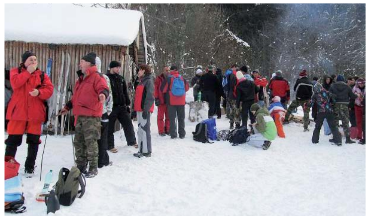
Pohľad na účastníkov na Črt'aži