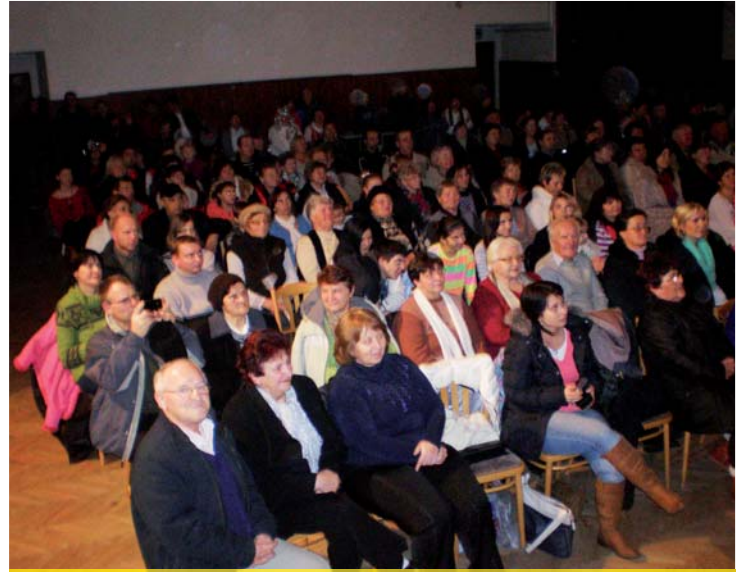
Pohľad do preplnenej sály