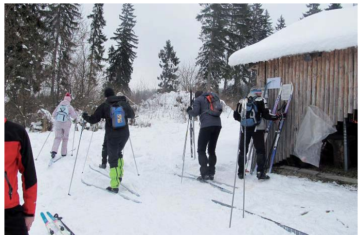
Po oddychu na Črt'aži pokračovali k Trom sosnám