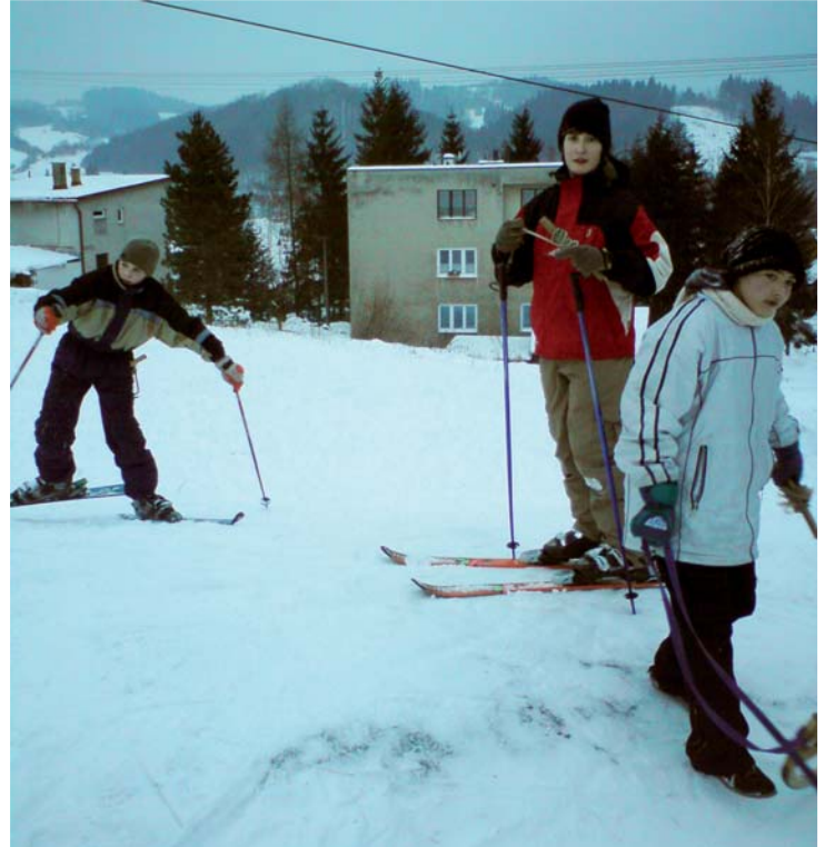
Najväčšiu radosť mali školáci

K dispozícii bolo aj hokejové klzisko pre korčuliarov, ale mierne mrazy to neumožnili. Tesne pred Vianocami začalo viac mraziť, ihneď to využili fanúšikovia hokeja a začali polievat' kurt, ale zbytočne. Mrázik trval iba dva dni a tým sa tuhšia zima skončila a korčuliari boli túto zimu odstavení od ľadu. Niektorí si to nahrádzali v obecnej posilňovni. ■ pb