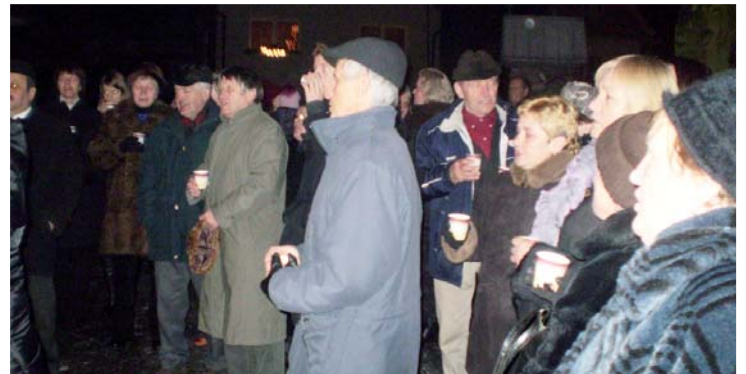
Pred kostolom oduševnene zneli vianočné koledy