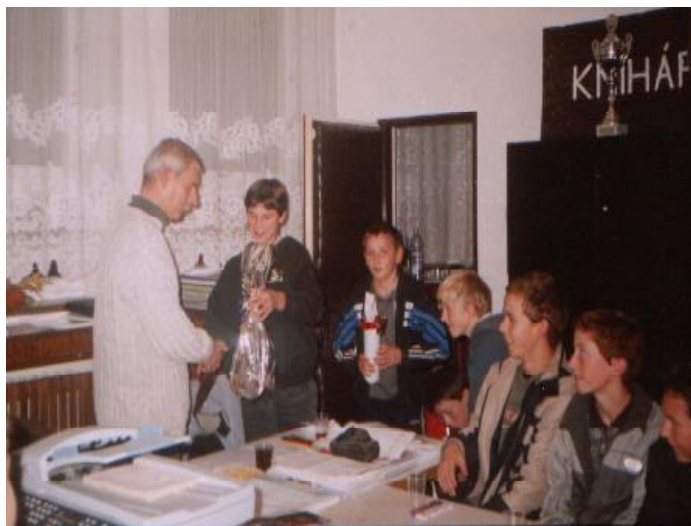
Futbalisti si vážia svojho trénera