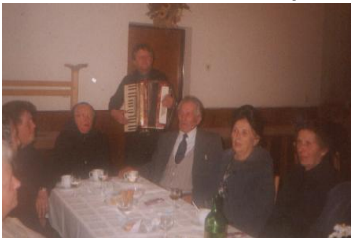
Spoločenské posedenie v rámci mesiaca úcty k starším