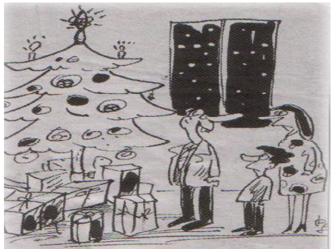
Nechápem tých, ktorí sú proti úplatkom, veď bez nich by sme nemohli mať takéto krásne, bohaté Vianoce.

Keď na narodenie Krista pršať začne, počas troch týždňov počasie bude mračné.