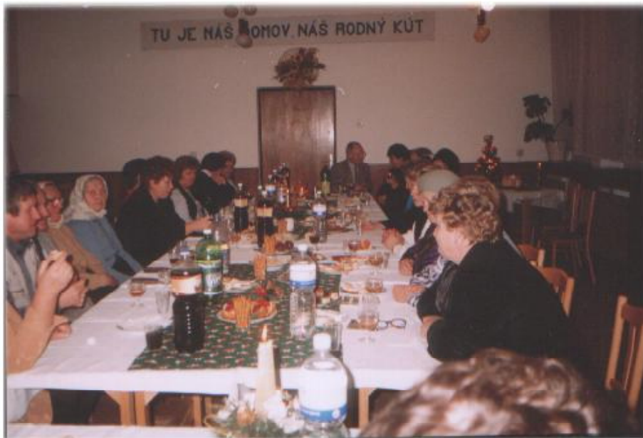
Pohľad na účastníkov novoročného stretnutia

Oravienka naša, najkrajšia na svete, teším sa v tebe ako kvietok v lete. Krásna si dedinka, ty rodná zem moja, krásne sú tie hory, kol' teba stoja, krásne je i nebo nad tými horami, žehnám ťa, vítam ťa vd'ačnými slzami.