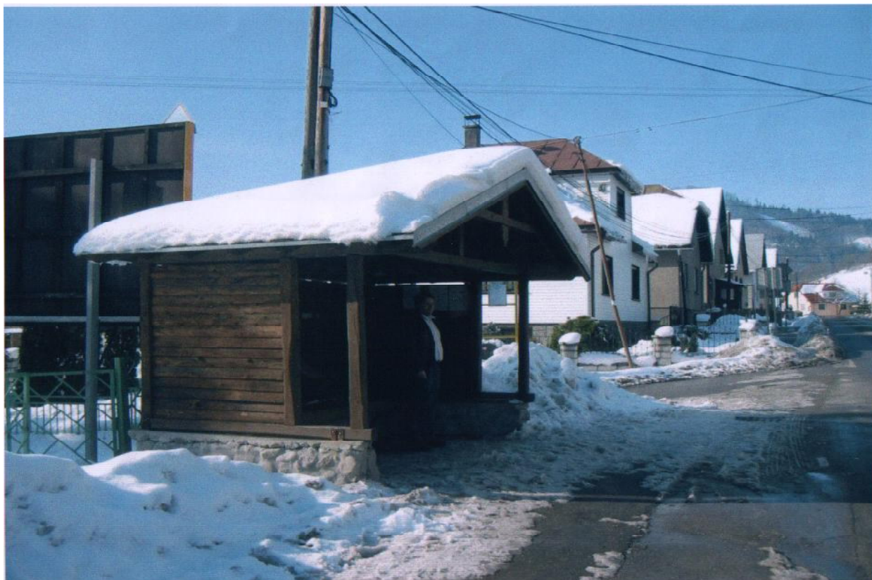
Zima 2005 v Sedliackej Dubovej