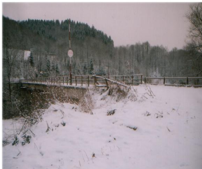
Pohľad na cestný most cez rieku Oravu