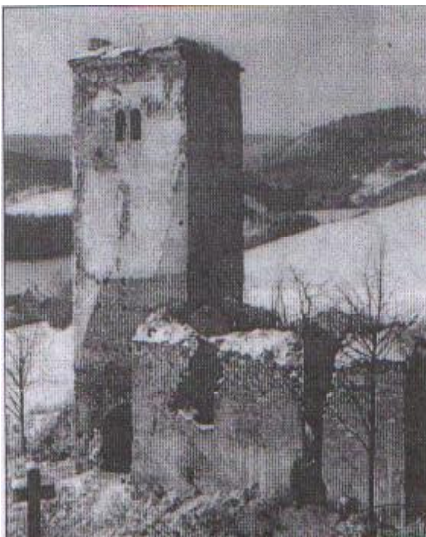
Zrúcanina starého kostola

fotografie návršia, zrúcanín kostola a tak naše rozhovory sa ešte viac konkretizovali.