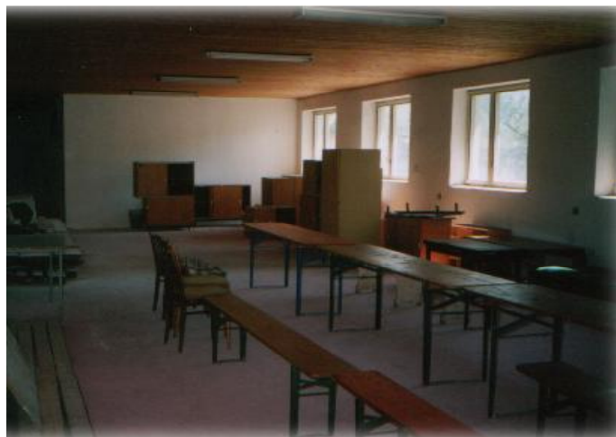
Vynovené priestory šatní