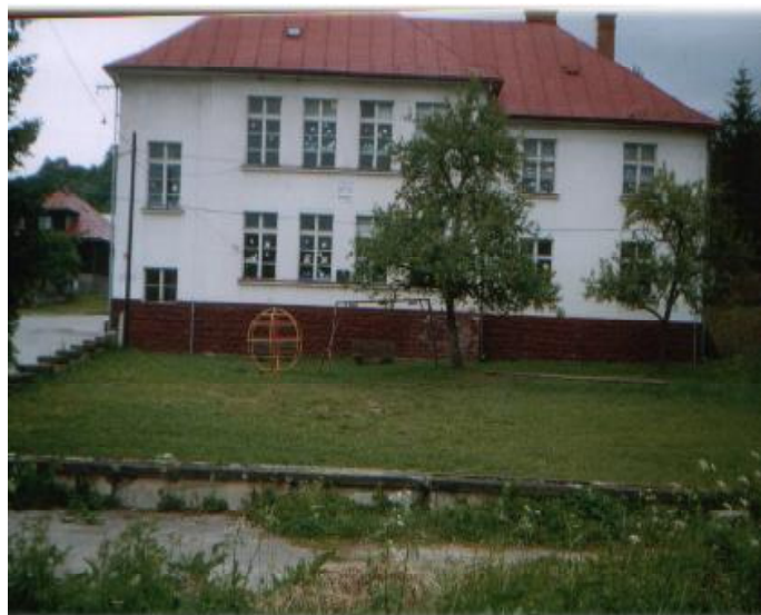
Pohľad na areál základnej a materskej školy