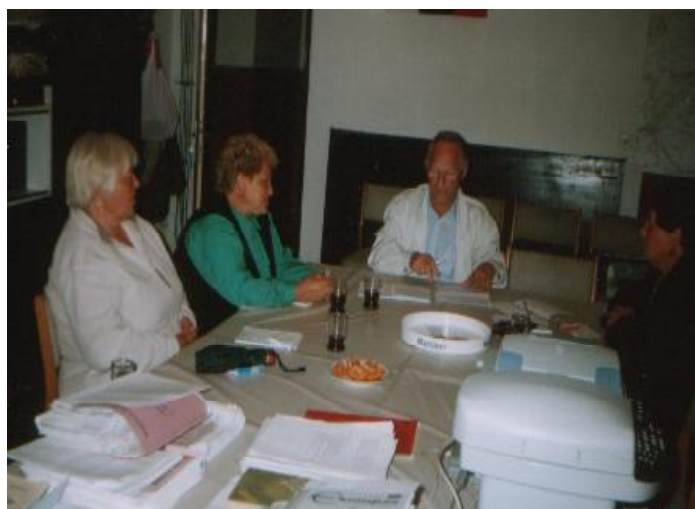
Príprava okresného zasadnutia JDS