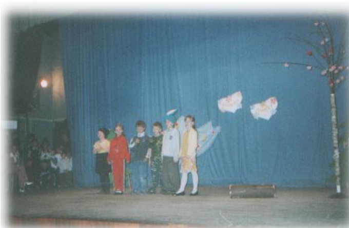
Deti základnej školy