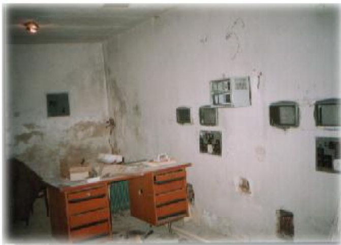
Takto vyzerali priestory v premietacej kabíne

Dnešná spoločnosť sa prejavuje aj množstvom nezamestnaných, ktorých často vidíme v uliciach našich miest a dedín, ako sa podieľajú na prácach verejných priestranstiev. S týmto javom sa stretávame aj v našej obci. Naši nezamestnaní pracujú v rámci verejno-prospešných prác v týždni dva dni po päť hodín. Týmto majú možnosť získať aktivačný príspevok, prípadne sú oslobodení od pravidelného hlásenia sa na Úrade práce v Dolnom Kubíne. Aj keď tie dva dni je málo, predsa v obci urobia veľa prospešných a užitočných prác. Okrem skrášľovania obce a jej prostredia sa podieľajú aj na renovačných prácach v kultúrnom dome, v šatniach na ihrisku, prípadne v miestnej škole alebo v okolí kostola.