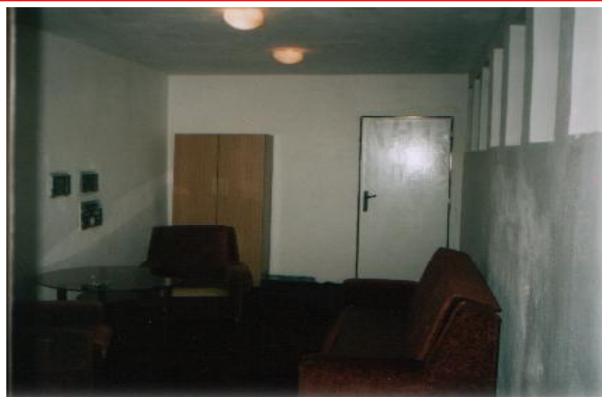
A takto vyzerá premietacia kabína po rekonštrukcii

-Toto všetko urobili naši nezamestnaní? Na toto ste potrebovali veľa finančných prostriedkov. Má obecný úrad toľko peňazí?