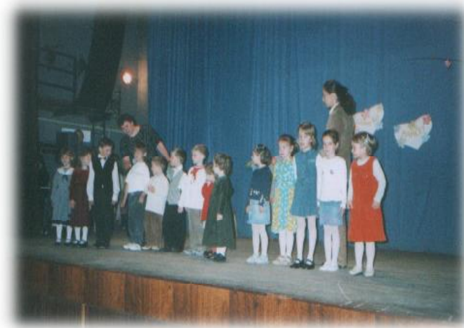
Deti z materskej školy s pani učiteľkami

Je dobre, keď ľuďom dôverujeme, ale v tomto prípade podomových obchodníkov treba byť v strehu, teda im nedôverovať a byť obozretný. Do príbytkov nepúšťať neznáme osoby. Treba si preveriť ich totožnosť, prípadne zavolať na obecný úrad, či tieto osoby majú povolenie. Naši občania môžu byť poučení aj z dennej tlače, rozhlasu, televízie, ako sa treba správať voči takýmto ľuďom. Nedá sa nič robiť, demokracia prináša aj takéto negatíva. /ph/