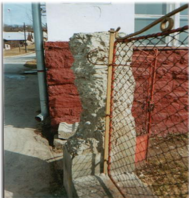
Takto vyzerajú stĺpiky v školskej záhrade