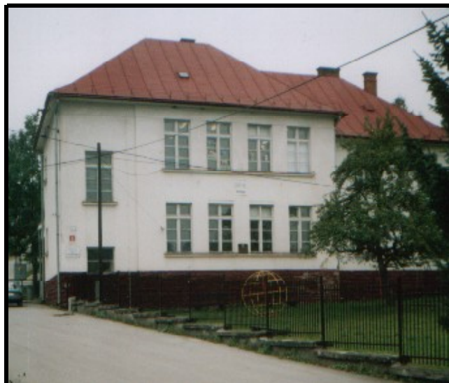
Areál ZŠ s MŠ