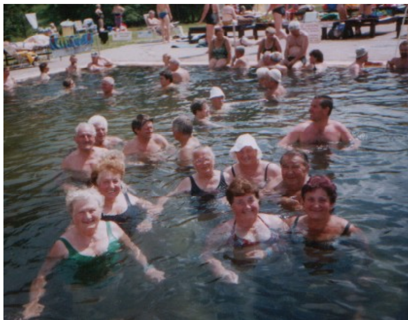
Takto si užívali v termálnom bazéne

V súčasnosti sa musí väčšina občanov, ktorí nemajú schopnosť podnikat' a obchodovať, nereštituovali alebo mladí bez finančného zázemia rodičov, alebo vekove starší, ktorí majú iba dôchodok vrátane hrozivého počtu nezamestnaných, vyrovnat' s tým, že ušľachtilosť, serióznosť, statočnosť a múdrosť sa vskutku nevyjadruje v korunách, v dolároch či v eurách. Je tu dosť občanov, ktorí sú takpovediac úspešní. Buď mali príslovečné šťastie, mohli zúročiť svoje schopnosti a odbornosť, alebo sa vynasli a rôznymi spôsobmi sa postarali, aby im stučneli bankové kontá. Práve na tejto skupine