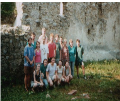
Tohoroční účastníci pred zrúcaninou