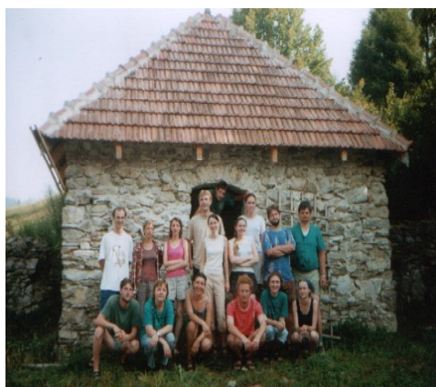
Pred zastrešenou kostnicou