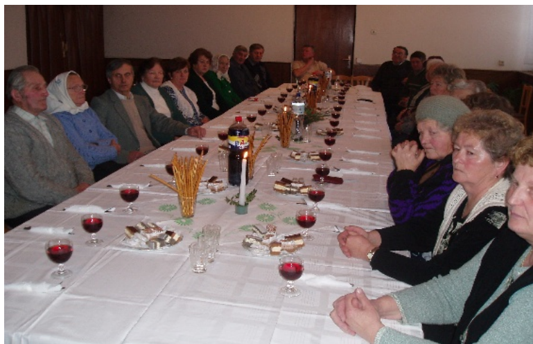
Pohľad do rokovacej siene