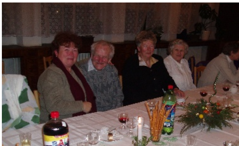
Pri posedení sa aj veselo zabávali