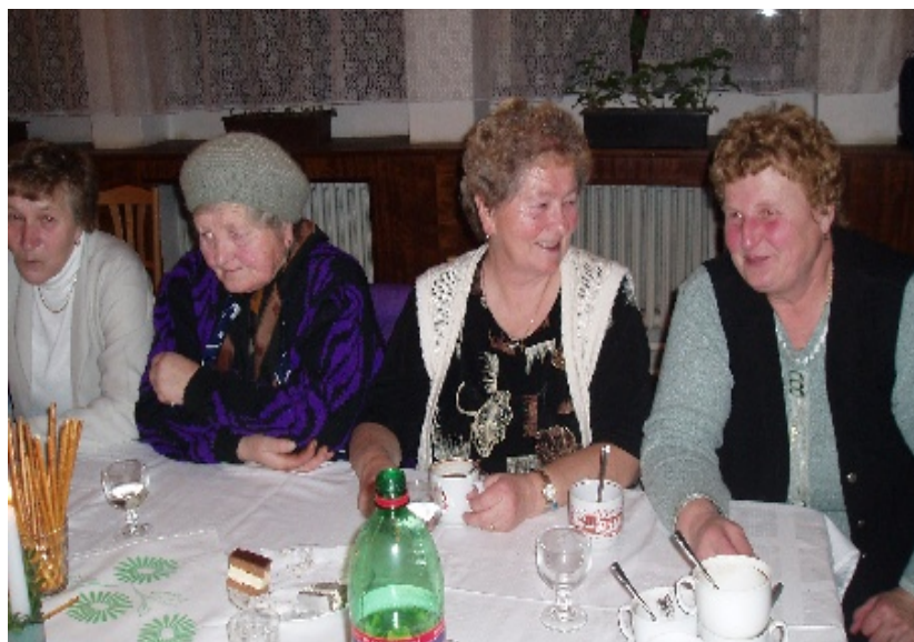
Zo spoločenského posedenia v januári 2006