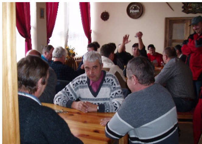
Pohľad na mariášistov