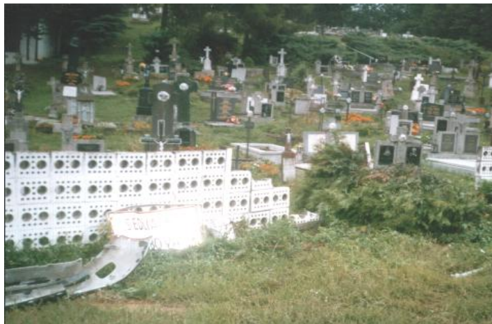
Pohľad po havárii