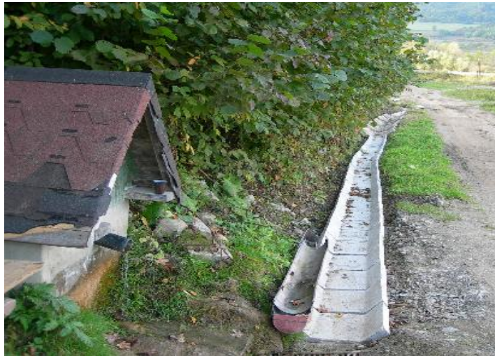
Teraz pred dokončením

Už je to deväť rokov, čo obec oslavovala 600-ročnicu. Vtedy sa slávnostná omša konala na drevenej konštrukcii na vršku Žiar. Za ňou bol vtedy skultivovaný briežok pod starým kostolom. Za tých deväť rokov táto plocha zarástla bujnou vegetáciou a chrastím. Z toho dôvodu sa obecný úrad rozhodol túto lokalitu vyčistiť, vypáliť nepotrebné kríky, vykosiť trávu, aby mnohí návštevníci starého kostola mali ľahší prístup do jeho okolia. Po dokončení týchto prác bude aj krajší výhľad z hlavnej cesty na túto dominantu nad našou obcou. V nočných hodinách je osvetlená a tým si robíme aj reklamu. Rekultivačné práce by mali byť dokončené do konca roka.