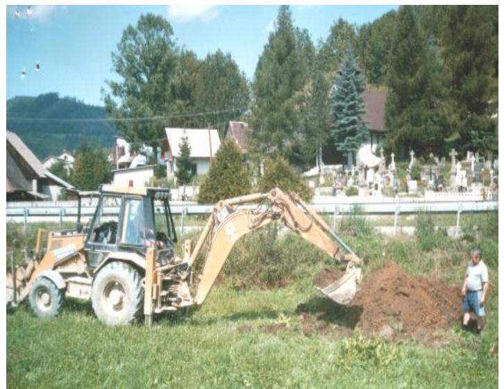
Takto sa hľadala porucha