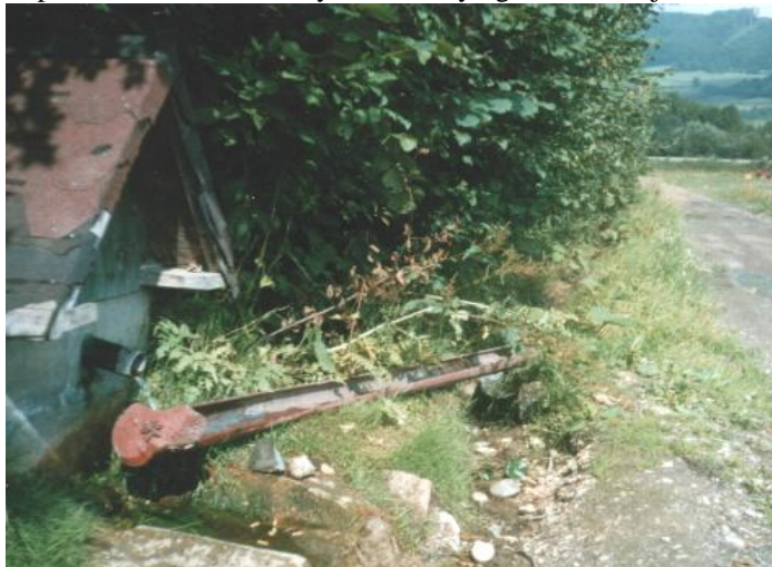
Predtým pri studničke