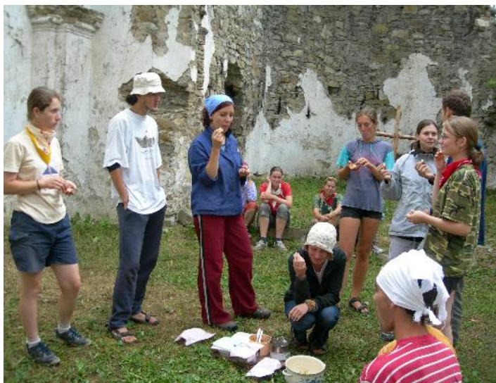
Pochutnávali si na vianočnej lahôdke