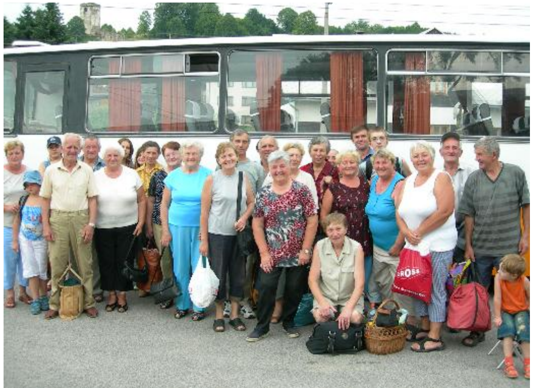
Účastníci zájazdu na kúpalisko v Oraviciach