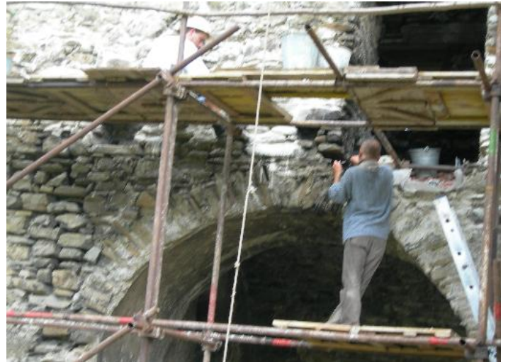
Práce pri konzervácii klenby kostola

Verím, že vízia sa po čase naplní, ale to potrebuje všetkých nás, nestačí len úsilie nášho duchovného otca. Tlaky musia byť zo všetkých strán – od organizácií, firiem a, samozrejme, od pamiatkarov. Spoločnými silami sa dá veľa urobiť, preto sa o to usilujeme!