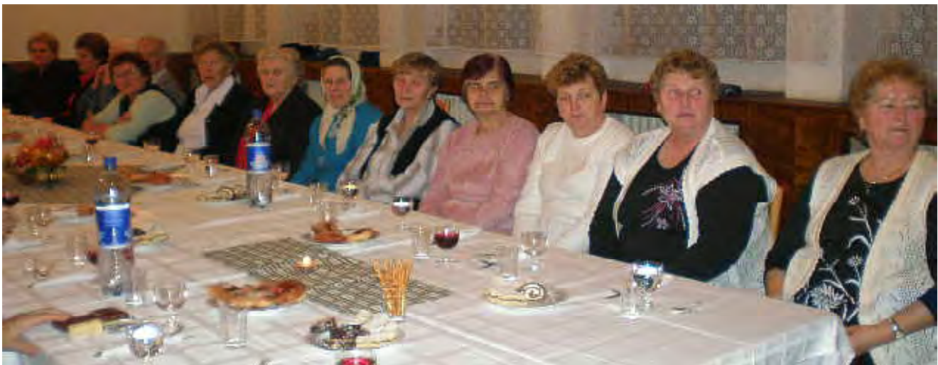
Pohľad do pléna