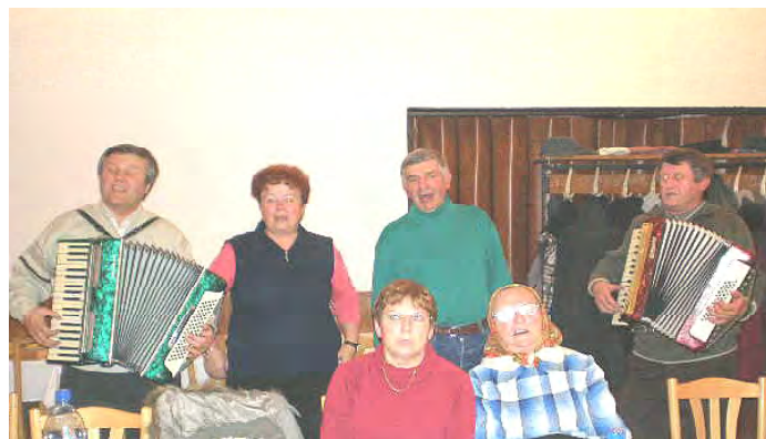
Radosť bolo počúvať dvojicu harmonikárov a spev