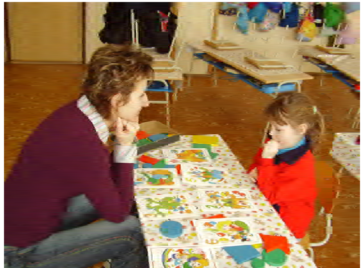
Pri testovaní budúcich prváčikov