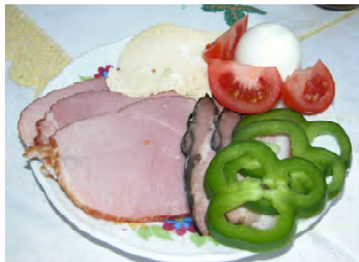
Tanier so šunkou, vajítkom, hrudkou a zeleninou

Spokojné prežitie veľkonočných sviatkov plné milosti a nádeje Kristovho zmŕtvychvstania našim spoluobčanom praje redakcia a obecný úrad.