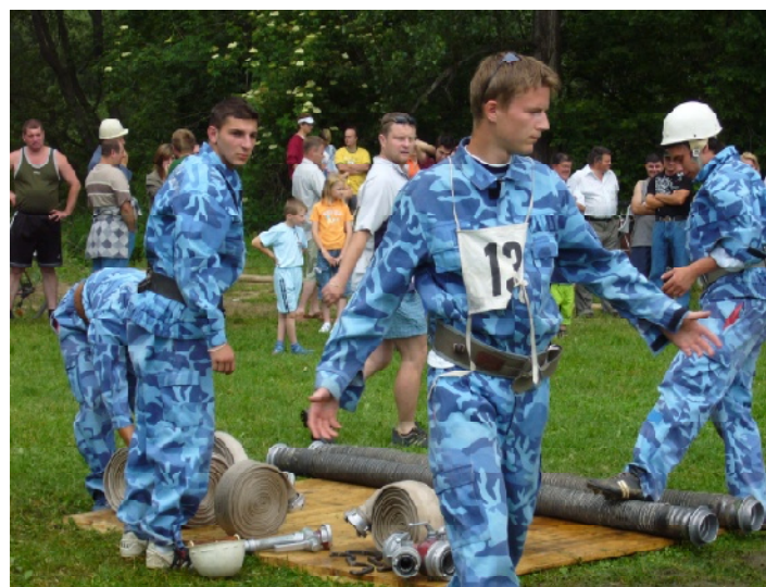
Chlapci v akcii