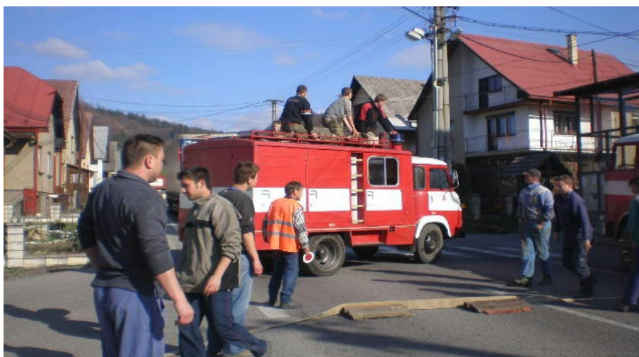
Naši hasiči pri fiktívnom zásahu