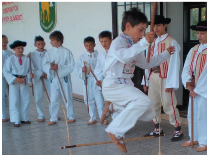
Deti z Podbiela