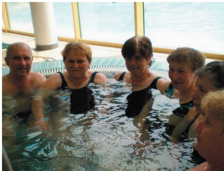
V perličkovom kúpeli