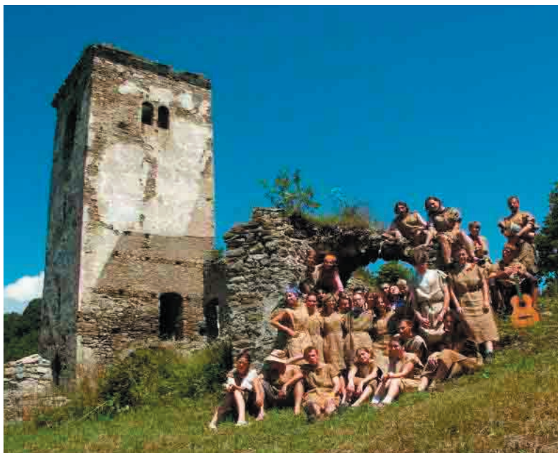
Takto pózovali strážcovia zrúcanín tajomných