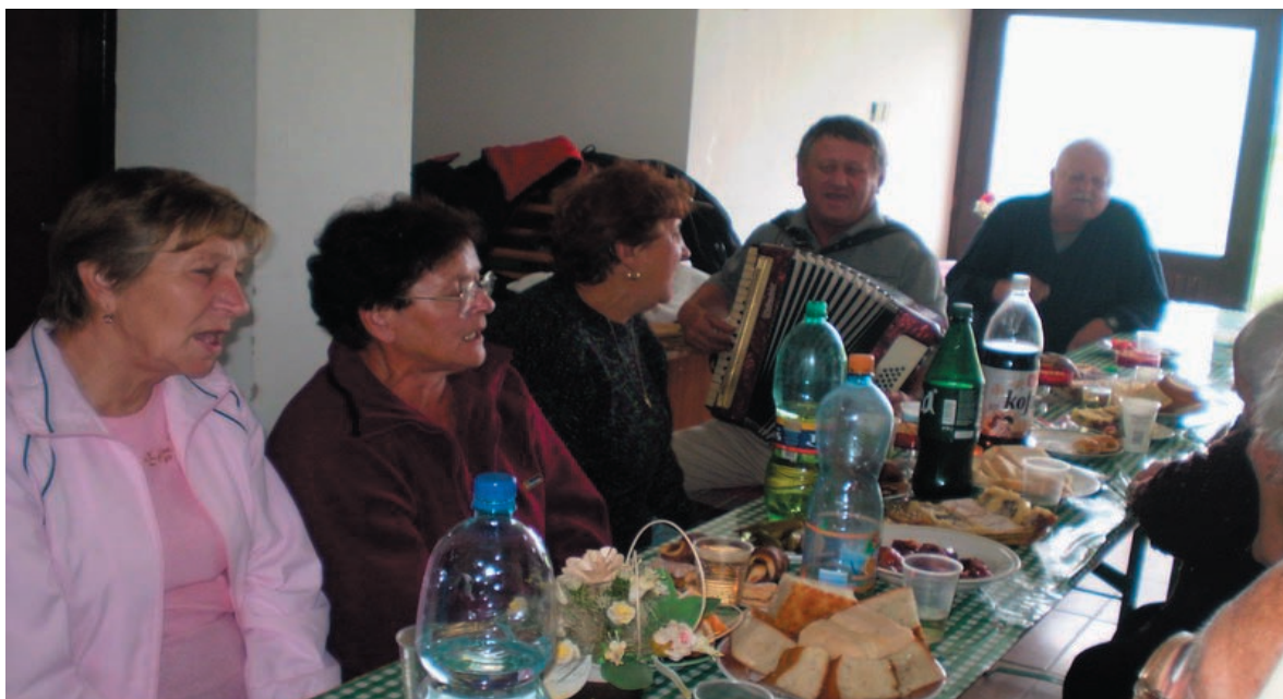
Ich útechou bol spev