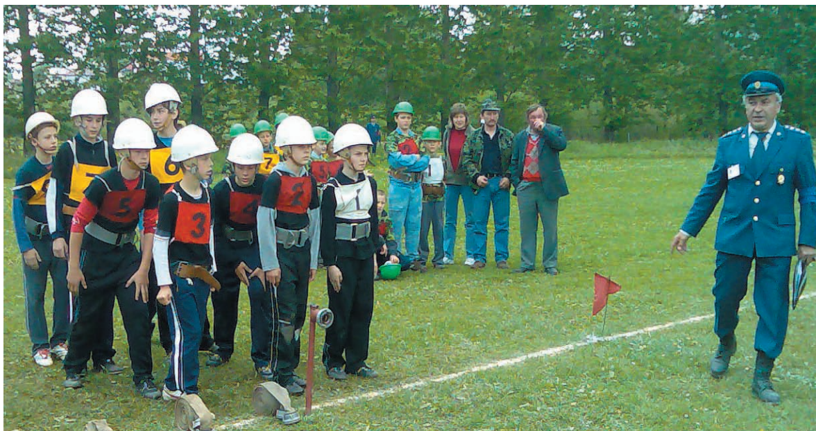
Plameňáci pred hasičským útokom v Lokci

Myslím si, že všetci naši občania sú hrdí na miestnych hasičov, lebo šíria dobré meno Sedliackej Dubovej a ich výsledky tomu nasvedčujú.