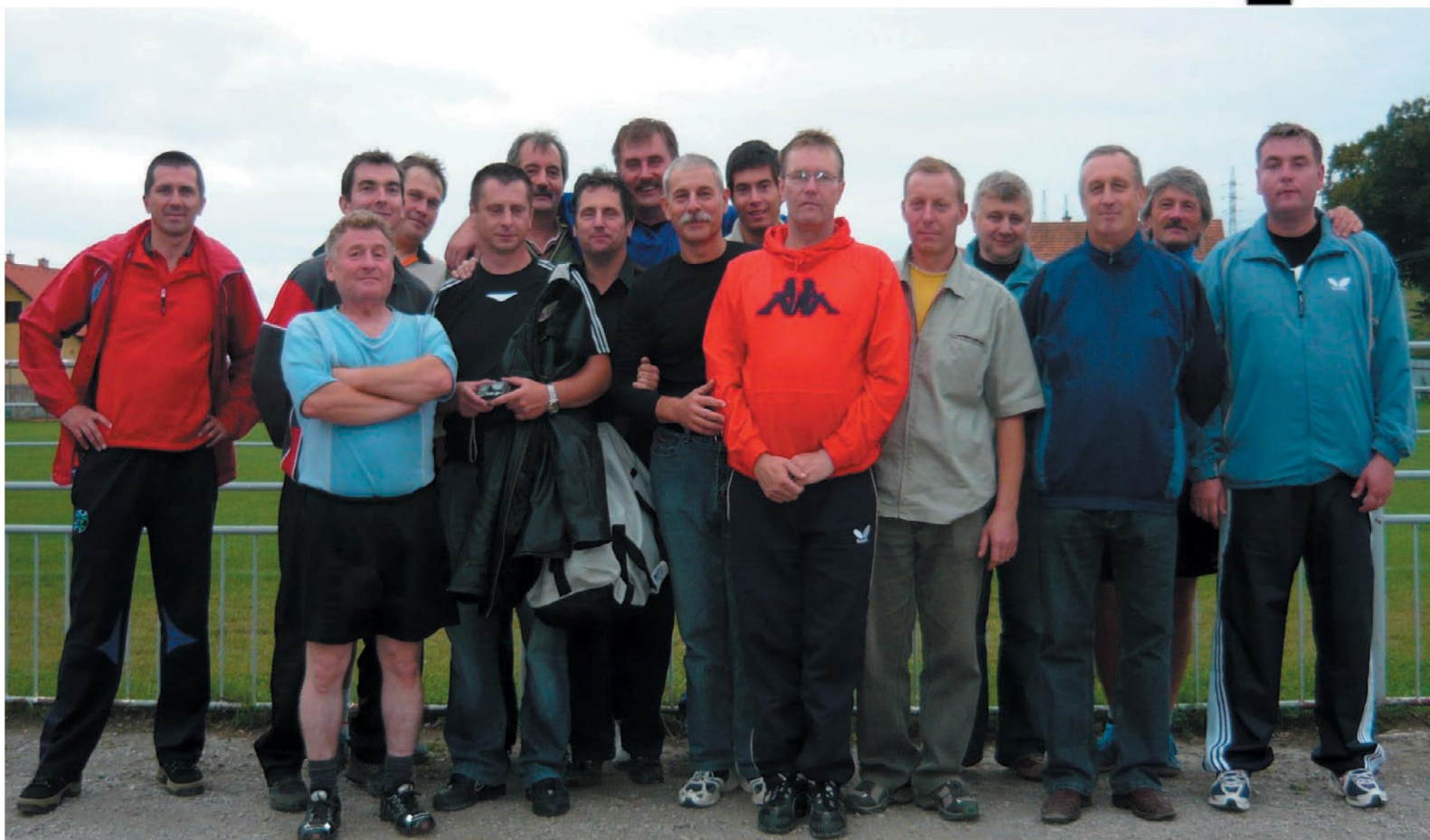
Partia tenistov v Harichovciach.