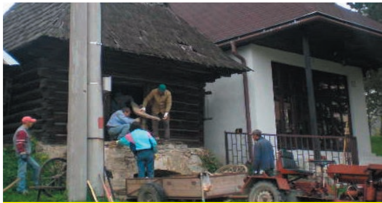
Sypáreň počas likvidácie. Na spodnom obrázku po ukončení prác

Pracovníci aktivačných prác v máji pracovali na likvidácii schátratej sypárne vedľa domu smútku. Zbúranie malo viacero dôvodov: po prvé, spôsobovala zamokanie domu smútku zo severnej strany a po druhé, prekážala výhľadu a