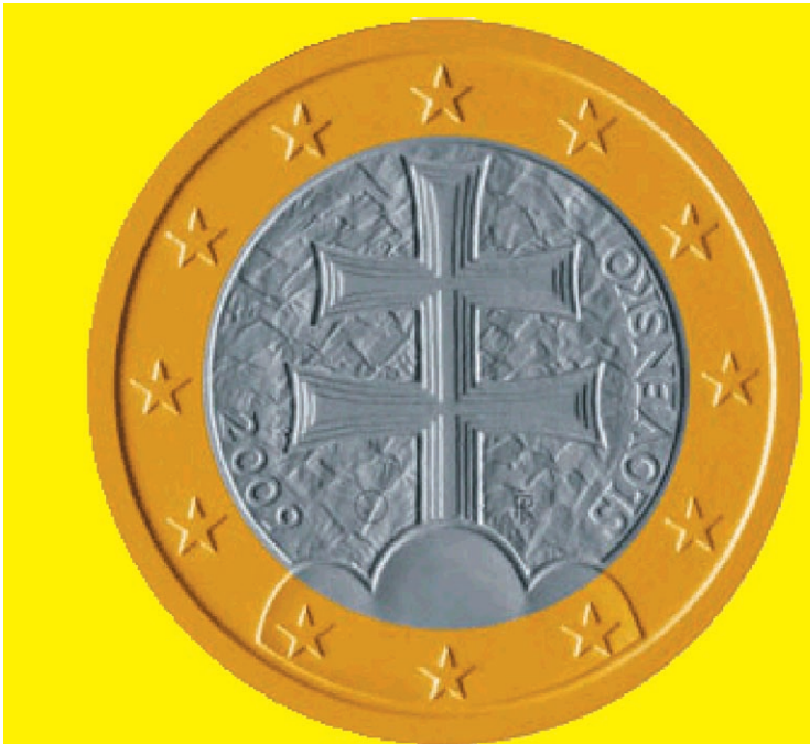
Slovenské 1 euro Dvojkríž na trojvrší

10. V platnosti ostanú aj všetky zmluvy. Sumy uvedené v slovenských korunách sa len prepočítajú na eurá podľa konverzného kurzu. Všetky ostatné podmienky budú nezmenené.