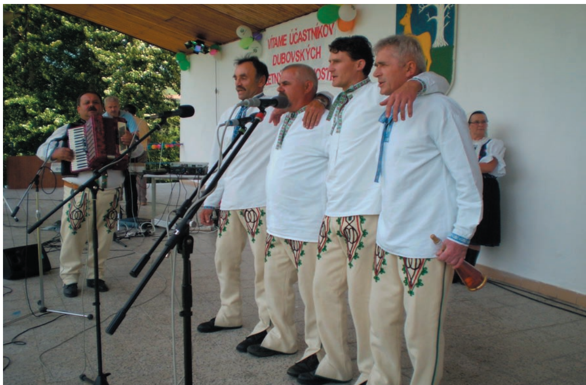
Hornolehotský folklórny súbor očaril svojim prejavom