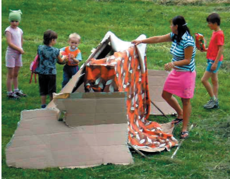
Postavený domček z kartónu potešil najmä škôlkárov