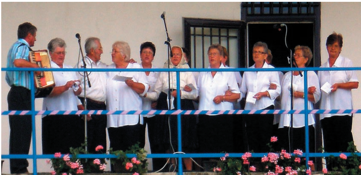
Takto vítali naši dôchodcovia účastníkov osláv