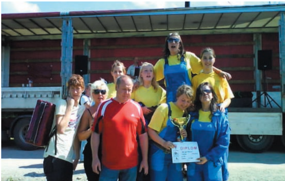
Záber zo súťaže v Kláštore pod Znievom