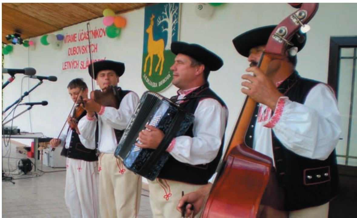
Súbor z Chlebníc zaujal celé publikum