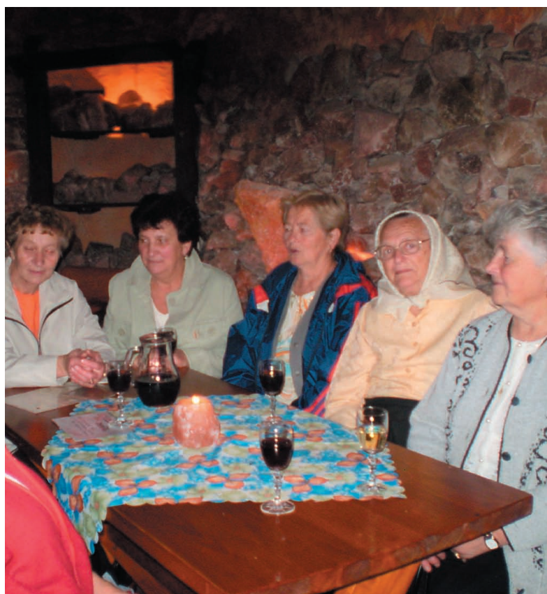
V dôvernej debata