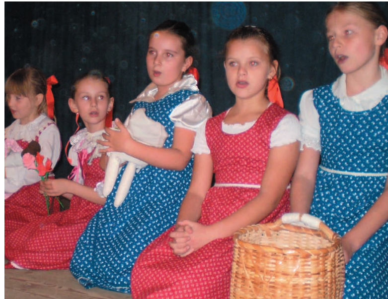
Detičky pozdravujú našich dôchodcov

Po skončení kultúrneho programu bolo pripravené pre všetkých dôchodcov v malej zasadačke pohostenie. Na príprave dobrôt sa podieľal obecný úrad za pomoci členov výboru klubu dôchodcov.