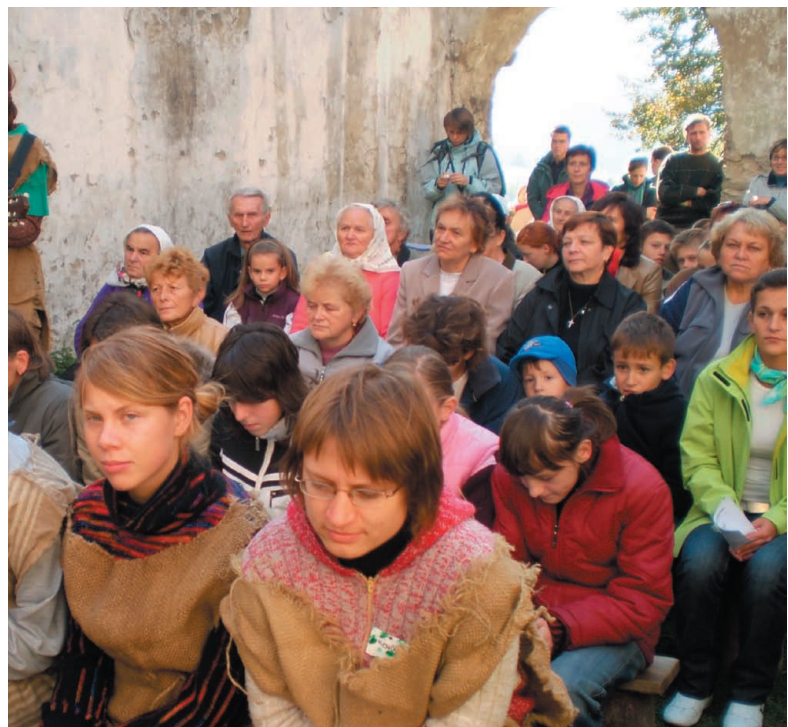
Prítomní pozorne počúvajú výklad evanjelia