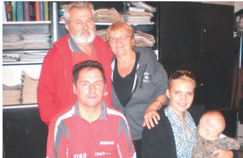
Rodina Pariškovcov na stolnom tenise v Sedliackej Dubovej