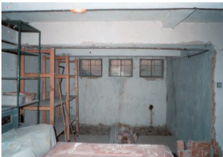
Priestory boli pred opravou v dezolátnom stave