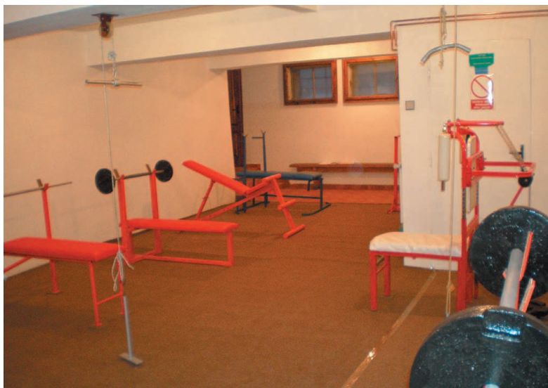
Zrekonštruované fitness čaká na nadšencov športu