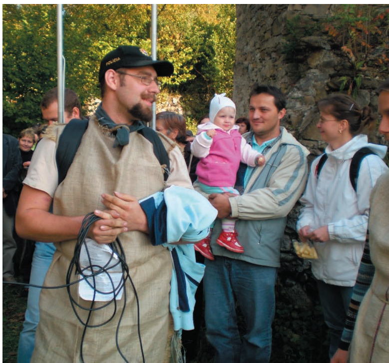
Prednáška o histórii kostolíka zaujala