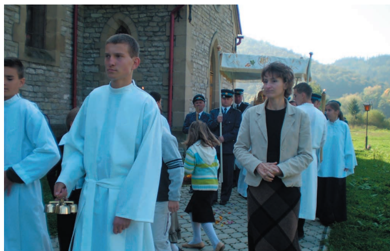
Slávnostná procesia kráča okolo kostola