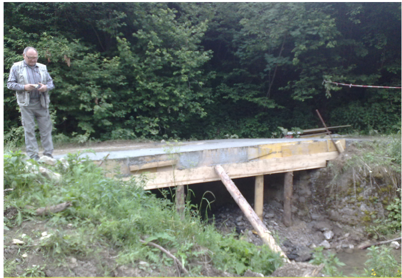
Opravený mostík smerom k lomu