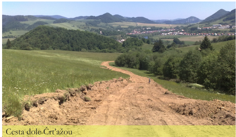
Cesta dole Črt'ážou