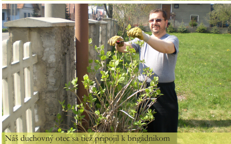
Náš duchovný otec sa tiež pripojil k brigádnikom