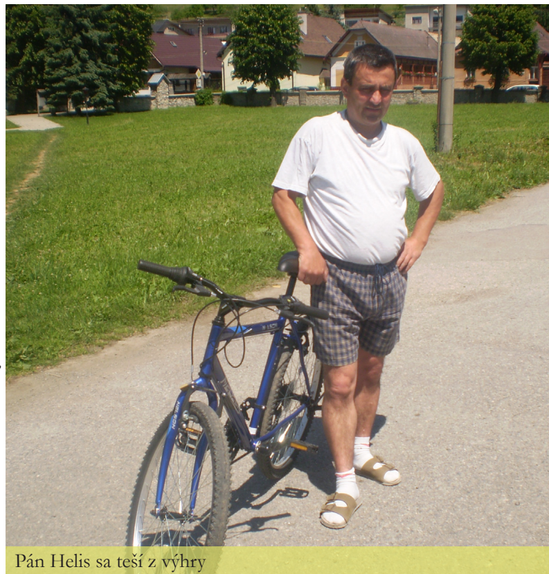
Pán Helis sa teší z výhry