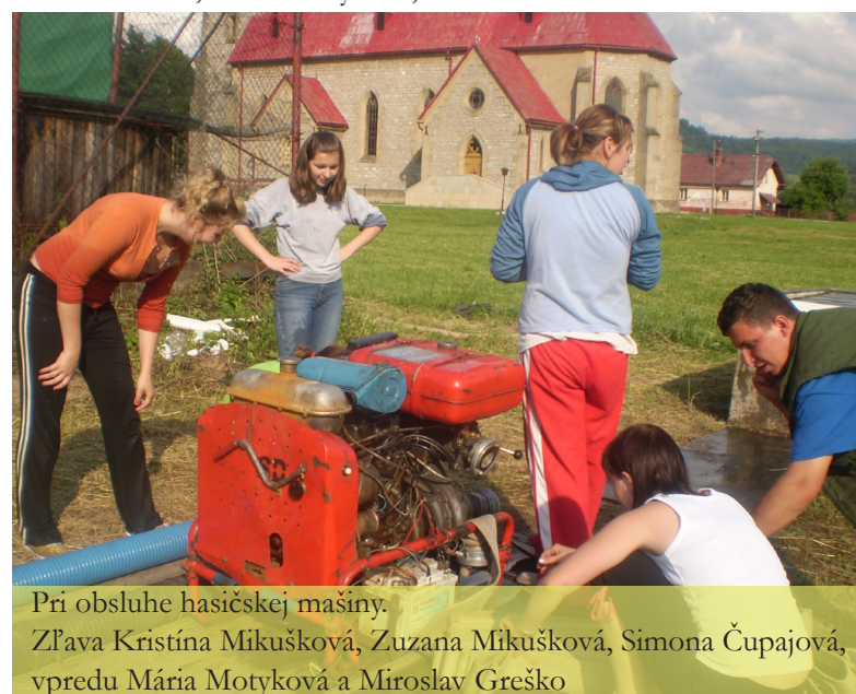
Pri obsluhu hasičskej mašiny.