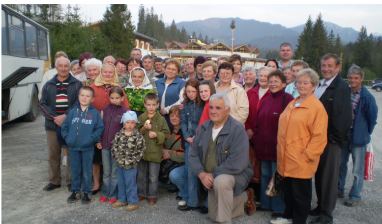
Spoločné foto pred MEANDER PARKOM