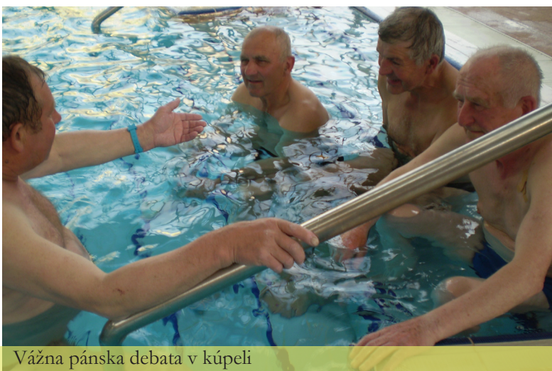
Vážna pánska debata v kúpeli

Slovo dalo slovo a hneď sa naplnilo skutkom. O čo skutočne išlo? O spoluprácu dôchodcov našej obce a susednej Dlhej nad Oravou pri organizovaní spoločných akcií, o ktoré majú záujem obe strany.