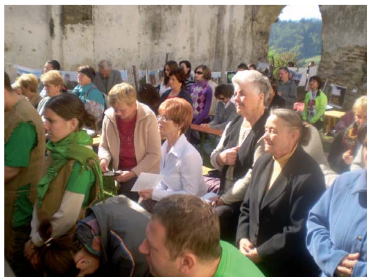
Na sv. omši sa zúčastnilo veľké množstvo veriacich