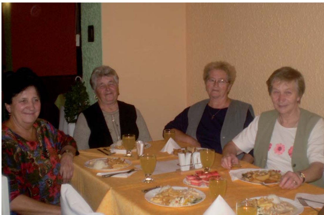
Pohľad na prestretý stôl k obеду