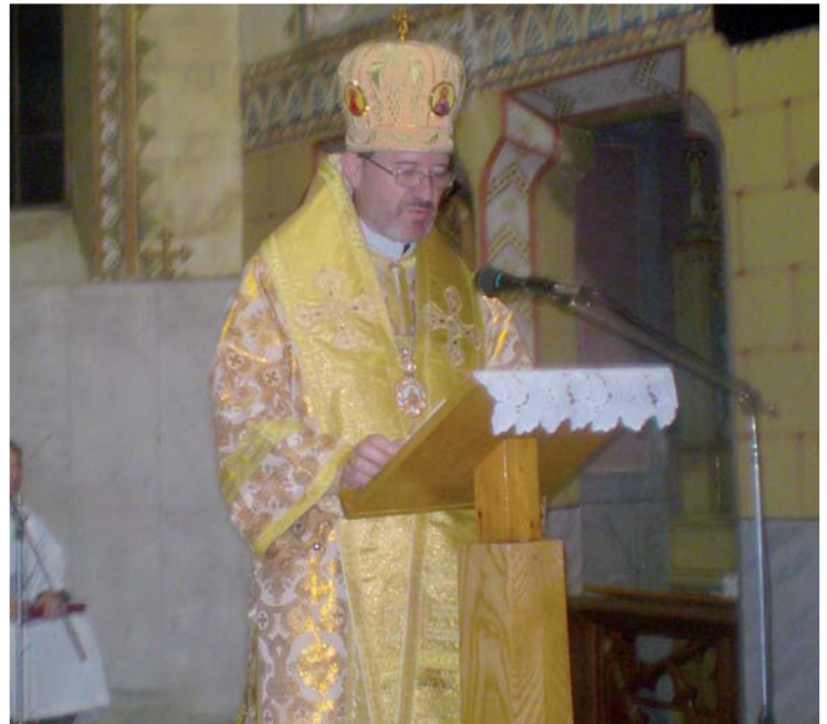
Biskup v homílii prejavil úctu k oslávenkyňi

Vyštudovala zdravotnú školu a ako rehoľná sestrička pracovala v bratislavskej nemocnici na internom oddelení. V apríli z 13. na 14. v noci v roku 1950 bola spolu ďalšími sestričkami násilne odvečená na štátny majer pri Piešťanoch. Ubytované boli v maštali. Robili najpodradnejšie práce, na poli aj v daždi. Odtiaľ ich deportovali do Jaroměra v Čechách do textilnej fabriky JUTA, kde tkali vrecia. Odtiaľ bola sestrička premiestnená do domova dôchodcov v Přelouči. Tu sa starala o bezvládných starých ľudí. Jej cesta pokračuje ďalej do psychologického liečebne vo Veľkom Záluží už ako zdravotná sestra. Postihla ju vážna nemoc a vtedy ju preložili na faru do