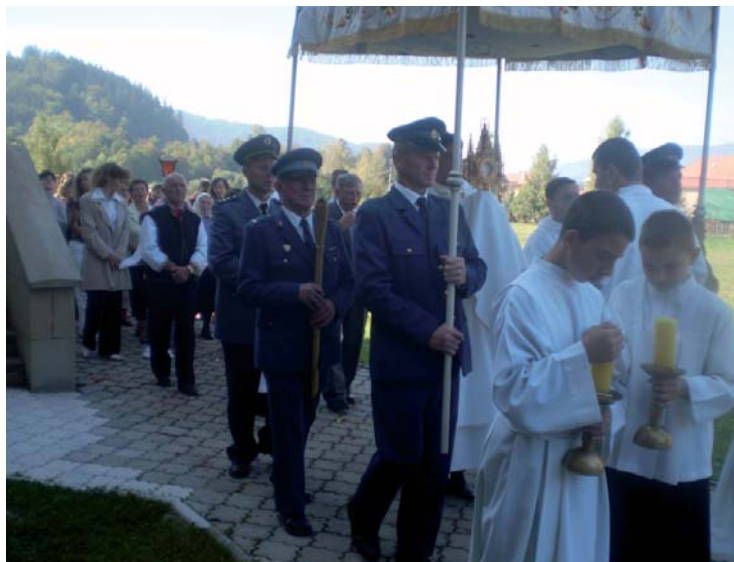
Súčasťou podujatia bola aj odpustová svätá omša na druhý deň v nedeľu

radé sú najakútnejšie časti pamiatky, ktoré sa rozpadávajú a potrebujú okamžitú opravu.“