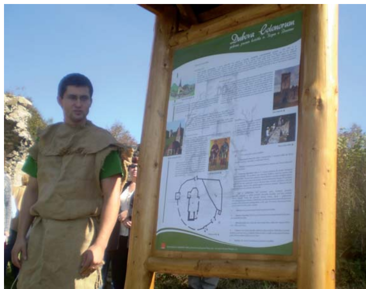
Odkrytá informačná tabuľa o zrúcanine kostola