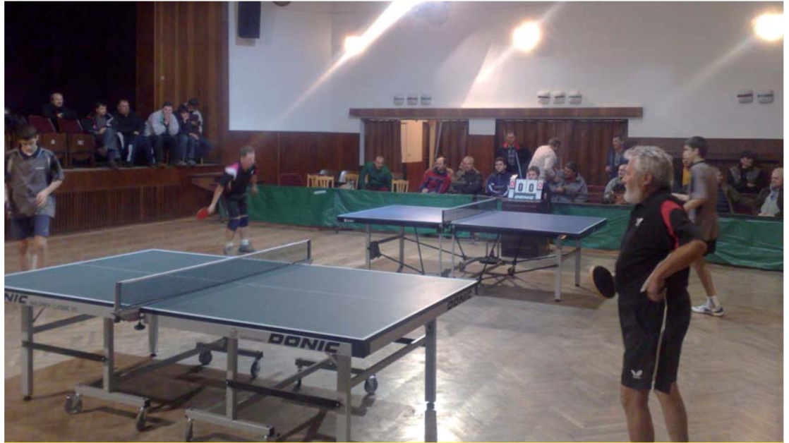
Dramatické stretnutie rivalov medzi Sedliackou Dubovou a Krivou

Pred každým začiatkom sezóny si všetky družstvá určujú ciele. Aj v kolektíve TJ COSMOS Sedliacka Dubová si ich stanovili, aby sa udržali v jednotlivých ligách stolného tenisu na Orave tak, ako to bolo v minulom roku. Nikto nečakal raketový štart A družstva pôsobiaceho v 5. lige, tzv. najvyššej oravskej súťaži. Po 10. kole jesennej časti je A družstvo na 3. mieste. Pritom má ešte zápas k dobru na domácej pôde s predposlednou Brezou.