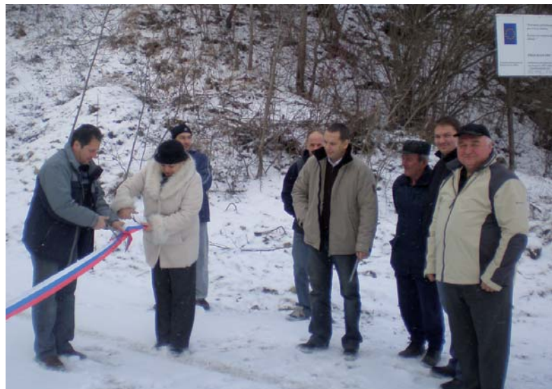
Prestrihávanie pásky pri kolaudácii 17.12.2009