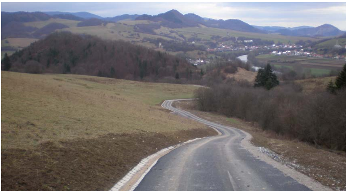
Pohľad na vybudovanú cestu na Črt'áž

Všetci naši občania by si mali uvedomiť pozitíva pri realizácii pozemkových úprav. Samozrejme, že sa vyskytnú aj zá-pory, no vždy budú prevyšovať plusy. Myslíme si, že len ten môže oponovať, kto nerozmýšľa pragmaticky a nemyslí na budúcnosť. Iste po rokoch budú mladí ľudia chváliť tých, ktorí sa podieľali na komasácii, pretože im prinesie možnosť získať ucelené stavebné pozemky, prístupové cesty v chotári, ktoré budú slúžiť nielen poľnohospodárom, ale aj poľovníkom, lyžiarom pre pešiu turistiku i cyklokros. Veď už teraz pri vybudovaných cestách na Črt'áž a do Sujova sa dá uskutoč-niť krásna vychádzka nielen pre mladých, ale aj pre starších občanov. Môžu sa kochať pek-ným výhľadom na okolitú prírodu, ktorá vie liečiť psychické i fyzické ne-duhy človeka.