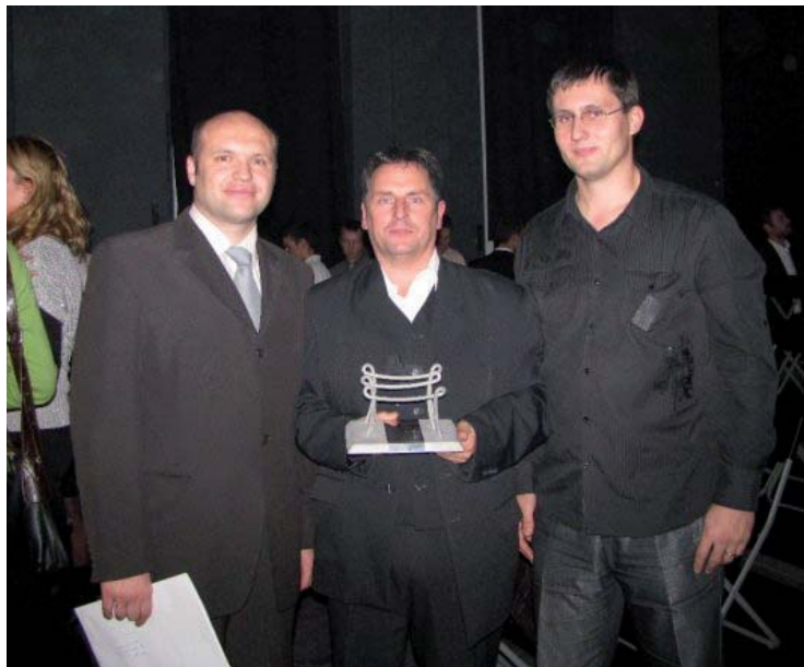
Starosta pri preberaní ocenenia

dobú všestrannú pomoc pri projekte Dubova Colonorum. Ocenenie MOST za podporu práce s mládežou sa každoročne udeľuje pri príležitosti