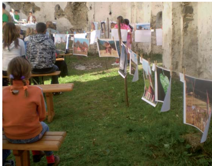
Múry kostola lemovali umelecké obrázky o zrúcanine